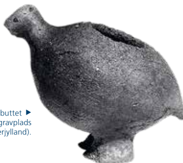
Lille lerkar formet som en buttet fugl fra Aarupgaard tuegravplads (Museum Sønderjylland).