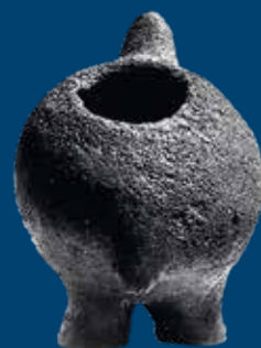
◀ Kleines Gefäß in Form eines rundlichen Vogels aus dem Flachhügelgräberfeld Aarupgaard (Museum Sønderjylland)