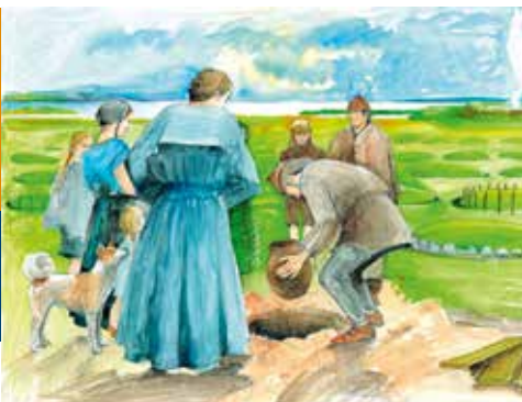
► Bestattung auf einem Flachhügelgräberfeld (Jette Jørgensen, Sydvestjyske Museer).

Wissenschaftler haben während der letzten hundert Jahre innerhalb des Grenzgebiets tausende von Gräbern ausgegraben. Dabei war der Fokus jedoch immer auf nationale Themen gerichtet, das heißt die deutschen und dänischen Archäolog:innen haben jeweils ihr eigenes Material untersucht. Das URNFIELD Projekt soll dies ändern.