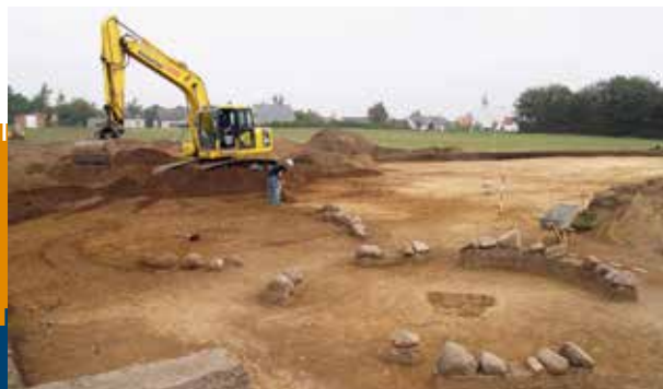
▲ Ausgrabung des Flachhügelgräberfelds Hammelev 2006.

Das Forschungsnetzwerk soll die Grundlage für weitere Projekte bilden, die diese einzigartigen archäologischen Befunde untersuchen sollen. Bei Einbeziehung von naturwissenschaftlichen Methoden und durch interdisziplinäre Zusammenarbeit sollen die Ergebnisse uns neue Informationen über die Gesellschaft der Eisenzeit liefern. Zum Beispiel können Analysen des Leichenbrandes Aufschluss über Geschlecht, Alter und Krankheiten der Verstorbenen liefern, oder wie mobil die Menschen gewesen sind – was durch den Strontiumgehalt ihrer Knochen erforscht werden kann.