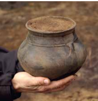
◀ Urne aus dem Flachhügelgräberfeld Aarre (Vardemuseerne).

URNFIELD wird gefördert durch Interreg Deutschland-Danmark mit Mitteln des Europäischen Fonds für regionale Entwicklung.